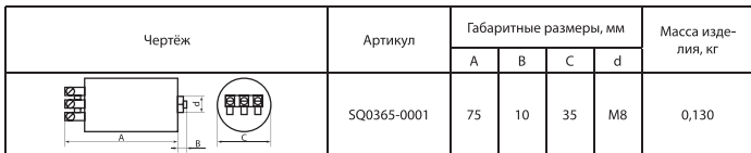
Таблица 2. Габаритные и установочные размеры

2.2 Габаритные и установочные размеры представлены в таблице 2.