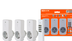
SQ1508-0204 – 1 приемник SQ1508-0205 – 3 приемника SQ1508-0206 – 5 приемников