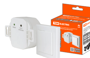
SQ1508-0217 «Умный выключатель»