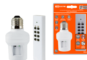
SQ1508-0201 – 1 приемник SQ1508-0202 – 3 приемника SQ1508-0203 – 3 приемника (диммируемые)