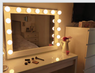
• Акцентная подсветка