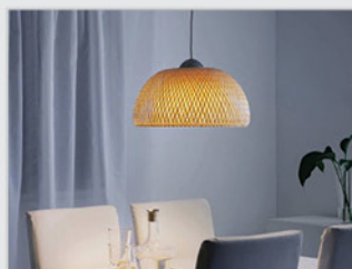
• Интерьерное освещение