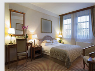
• Декоративная подсветка

ВНИМАНИЕ! Регулировка яркости свечения данных ламп осуществляется обычным выключателем. Включение диммера (регулятора яркости) в цепь не требуется!